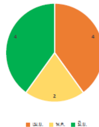
บริการงานวิจัยและทดสอบไตรมาส 3 ปีงบประมาณ 66 (จำนวนโครงการ)